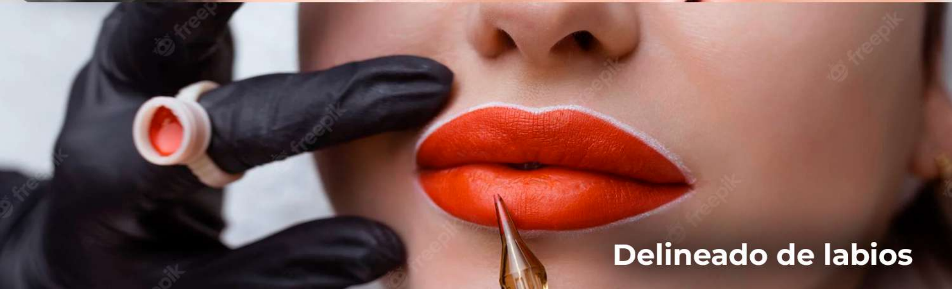
Delineado de labios